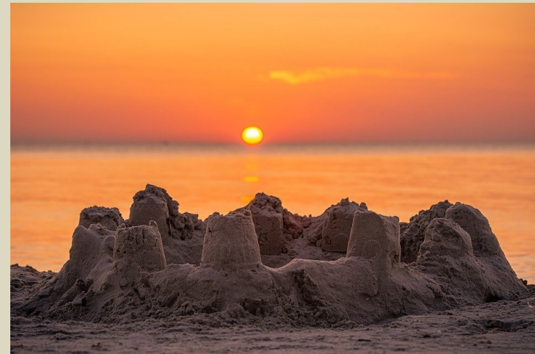
Kan jij de torens van dit zandkasteel tellen?

+ Welk gevoel roept koning Salomo bij jou op?