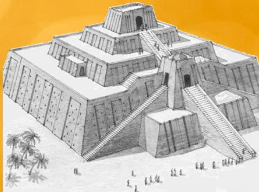
Mogelijke vorm van de toren van Babel. Fundament 91 bij 91 meter.